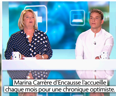
Marina Carrère d'Encausse l'accueille chaque mois pour une chronique optimiste.

Je vais raconter des histoires de personnes inspirantes aux parcours atypiques qui ont utilisé le sport comme outil de résilience face à des épreuves. Il y aura des sportifs de haut niveau, des anonymes et pas forcément des handicapés.